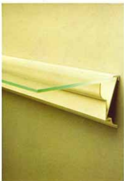
Objetos diseñados por Oscar Tusquets

— Creo que la cuestión de la Ergonomía está algo desorbitada.