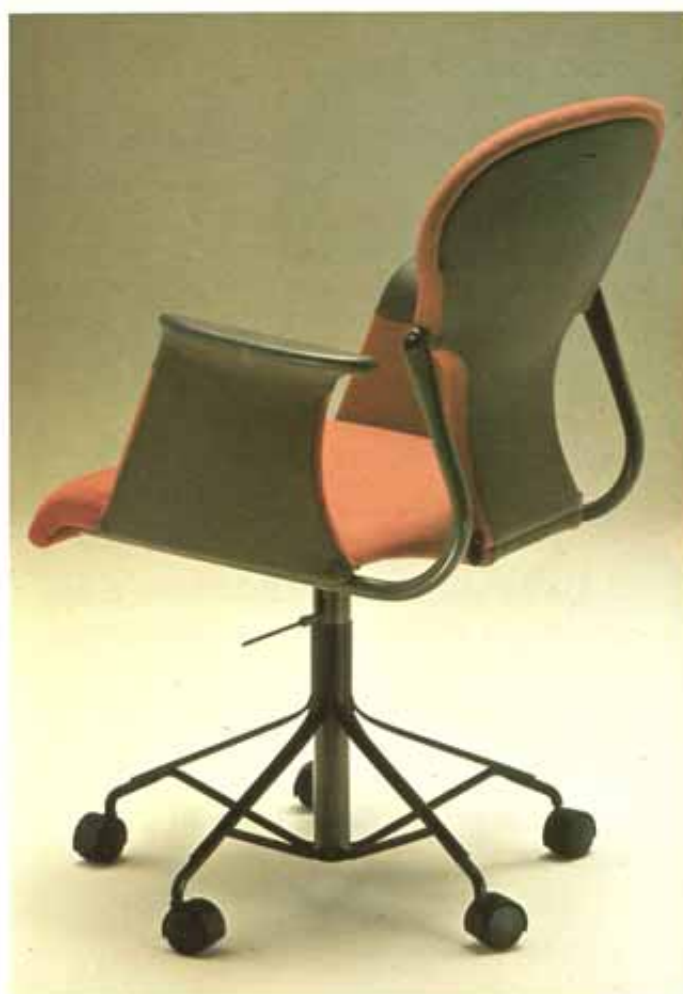
Los aspectos de una destacada realización de Oscar Tusquets. La silla VARIUS para MOBILPLAST (premio FAD de la crítica en 1984).